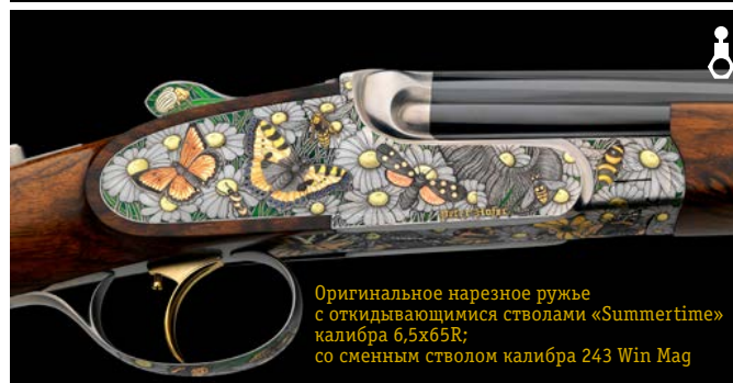
Оригинальное нарезное ружье с откидывающимися стволами «Summertime» калибра 6,5x65R; со сменным стволом калибра 243 Win Mag