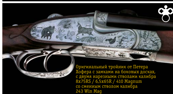
Оригинальный тройник от Петера Хофера с замками на боковых досках, с двумя нарезными стволами калибра 8x75RS / 6,5x65R / 410 Magnum со сменным стволом калибра 243 Win Mag