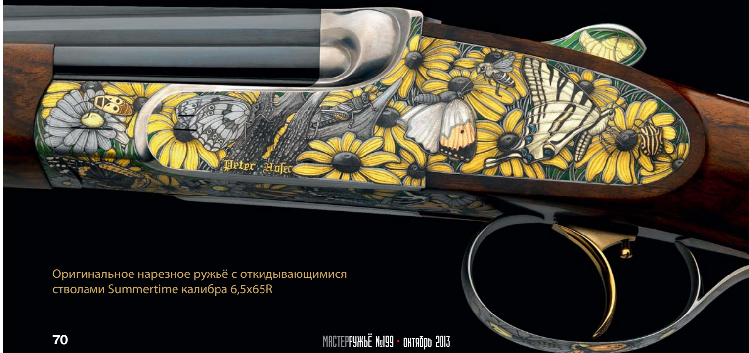
Оригинальное нарезное ружьё с откидывающимися стволами Summertime калибра 6,5x65R