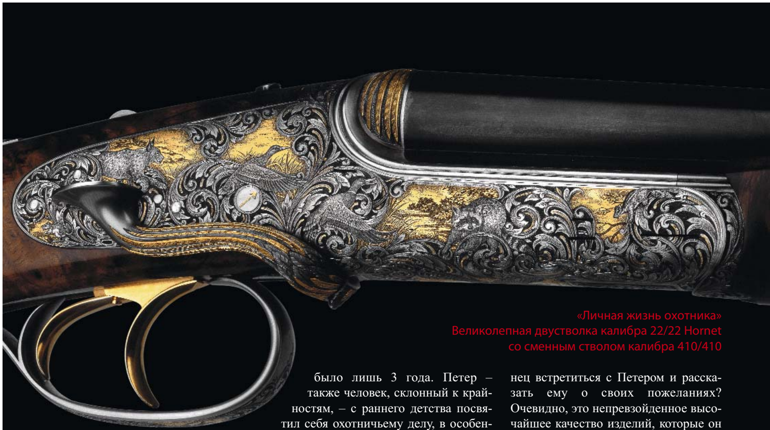
«Личная жизнь охотника» Великолепная двустволка калибра 22/22 Hornet со сменным стволом калибра 410/410

Достаточно вспомнить Хемингуэя, чтобы увидеть тесную, почти «эротическую» связь охотника со своим оружием. Этот великий американский писатель увековечил охоту во многих своих литературных произведениях.