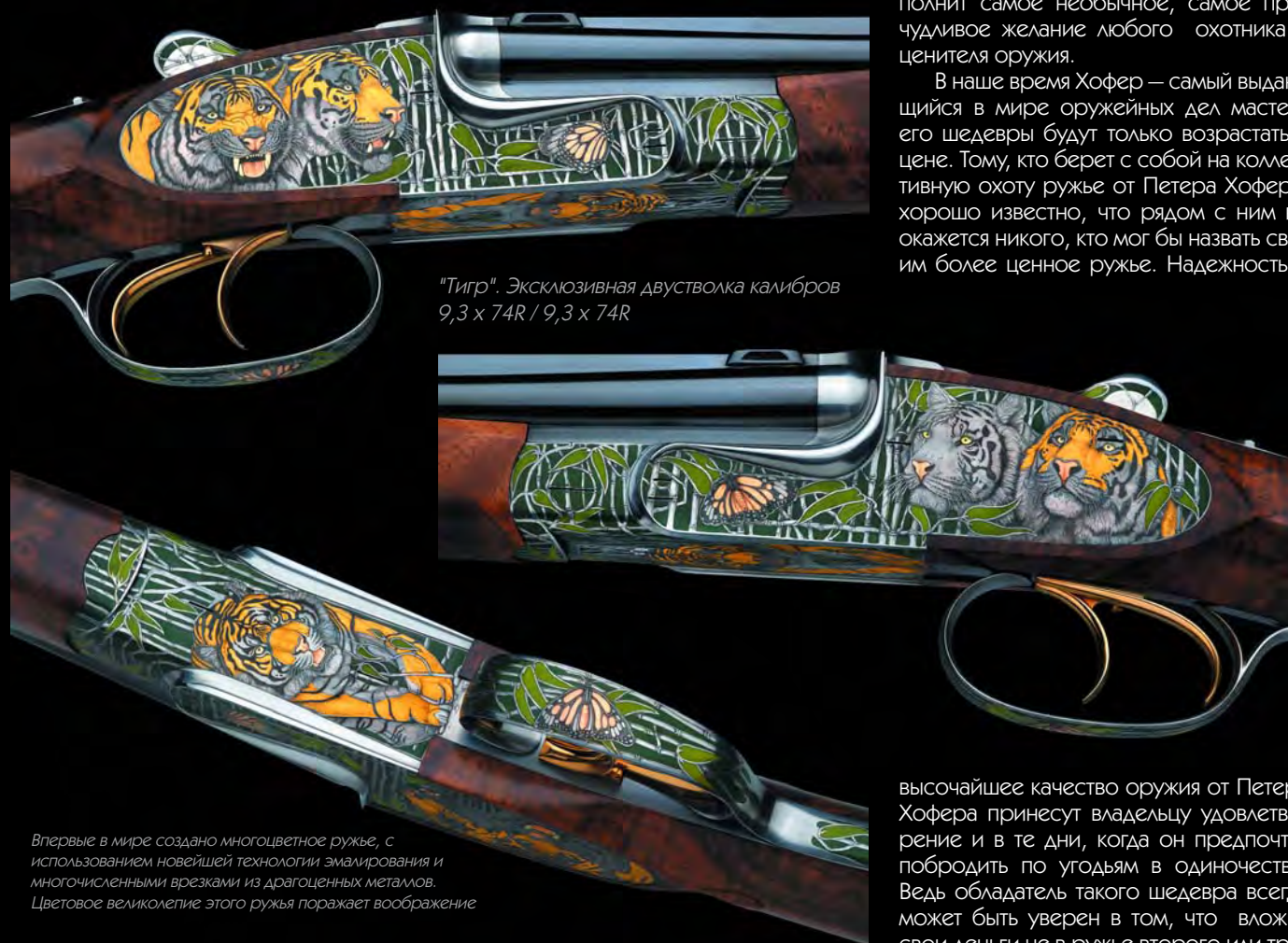
"Тигр". Эксклюзивная двустволка калибров 9,3 x 74R / 9,3 x 74R

Впервые в мире создано многоцветное ружье, с использованием новейшей технологии эмалирования и многочисленными врезками из драгоценных металлов. Цветовое великолепие этого ружья поражает воображение