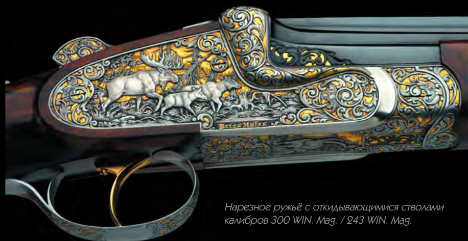
Нарезное ружье с откидывающимися стволами калибров 300 WIN. Mag. / 243 WIN. Mag.