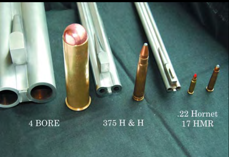
4 BORE 375 H & N .22 Hornet 17 HMR

А еще — все виды тройников, такие как: тройник с двумя нарезными и одним гладким стволом; тройник с одним крупным, одним мелким пулевым калибром и одним дробовым стволом; пулевые тройники; дробовые трой-