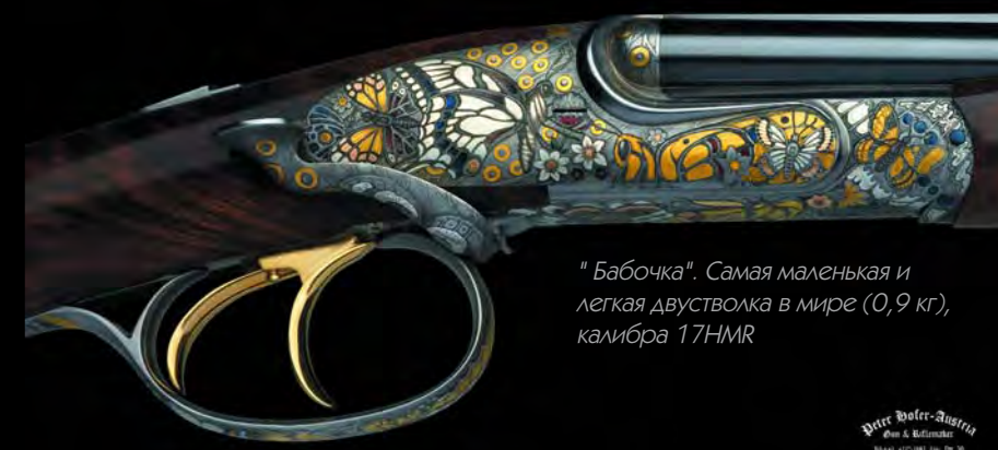
"Бабочка". Самая маленькая и легкая двустволка в мире (0,9 кг), калибра 17НМР

В последние годы Петер по специальным заказам своих клиентов — коллекционеров из США, Объединенных Арабских Эмиратов и России — с большой ув-