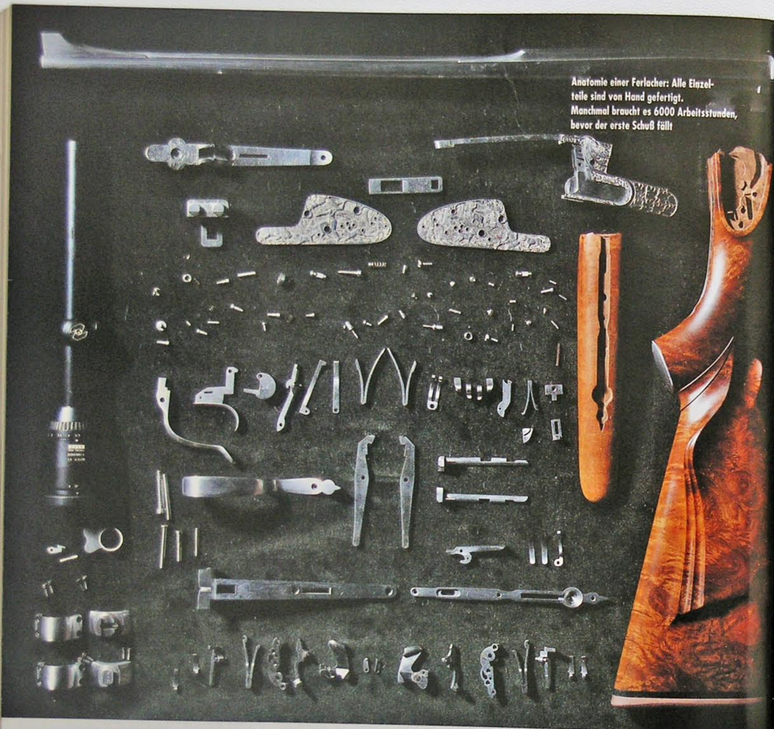
Anatomie einer Ferlacher: Alle Einzelteile sind von Hand gefertigt. Manchmal braucht es 6000 Arbeitsstunden, bevor der erste Schuß fällt