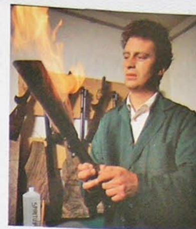
Feuer freil Um die Holzporen zu beseitigen, wird der Gewehrschaft mit Spiritus eingerieben und abgeflammt. Unten: Filigrane Gravuren sind Erkennungszeichen einer echten Ferlacher

Eine untypische Karriere. Denn als bestes Stück in der Waffensammlung wird jeder Grünrock seine Ferlacher auch nut-