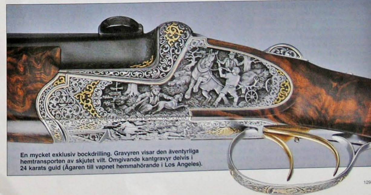
En mycket exklusiv bockdrilling. Gravyren visar den äventyrliga hemtransporten av skjutet vilt. Omgivande kantgravyr delvis i 24 karats guld (Ågaren till vapnet hemmahörande i Los Angeles).