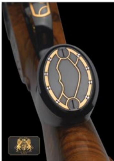
Pistoļroktura apakšpusē izvietotie rotājumi organiski turpina apdares "generālliniju".