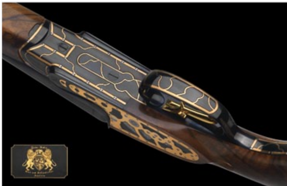
Sarkanā zelta rotājumi klāj arī mehānismu kārbas apakšdaļu un mēlītes aizsarglociņu.

Kā jau teikts, katrs "Technicart" ierocis ir vistīrākais roku darbs, tajā nav ne miņas no konveijera tipa pieejas, tādēļ arī jebkuram šim ierocim pēc pircēja individuālās