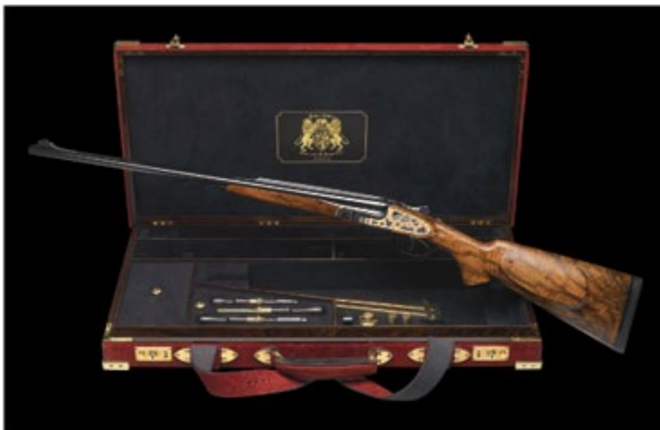
Tituls – Pasaulē modernākā vītņu divstobrene ar līdztekus (horizontāli) novietotiem stobriem.

Pirmā eksemplāra radīšanas brīdī un joprojām šis ierocis pelnīti nes titulu Pasaulē modernākā vītņu divstobrene ar līdztekus (horizontāli) novietotiem stobriem.